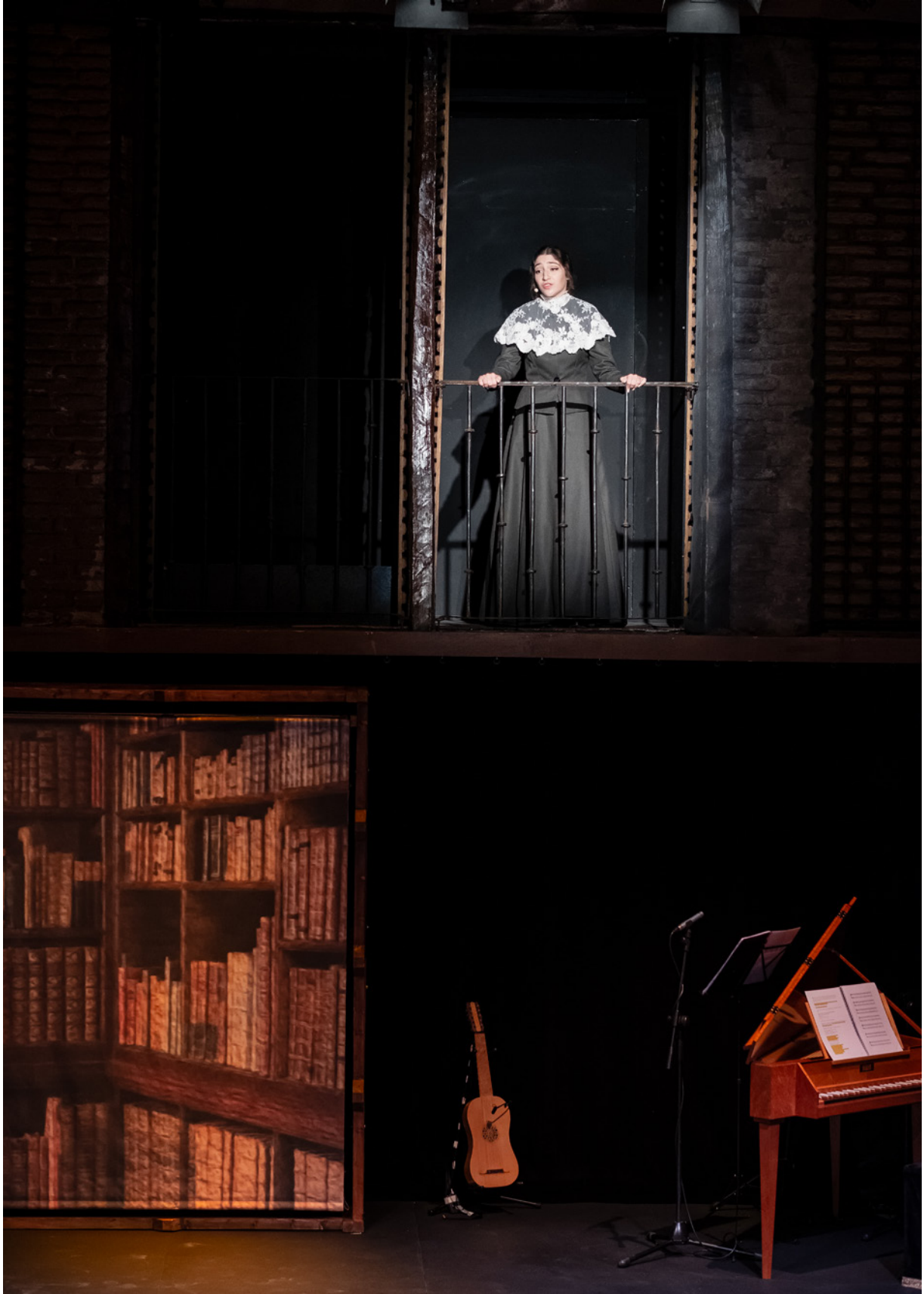
Fotos del estreno en el Festival Iberoamericano del Siglo de Oro de Alcalá de Henares (Clásicos en Alcalá), en el Corral de Comedias, 16 y 17 de junio de 2022.